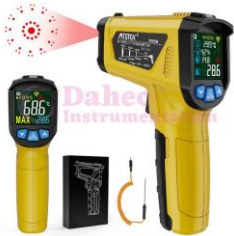
Termometro Infrarrojo 800B