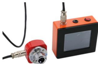
M. Ancho de grietas JW-JWCK102