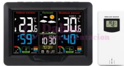
Estación Meteorológica FJ3383C