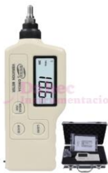
Vibrometro Tipo Pluma GM63A