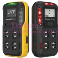
Detector de 4 gases CPDW5X1H1M1Y00