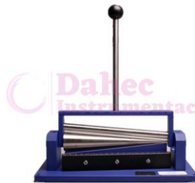
Mandril Cónico BGD566