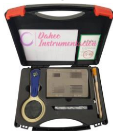
Regla de corte cruzado BGD503