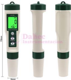
M. de PH/Tds/Temp JQ-006