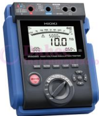
Medidor de Aislamiento Hioki IR5050