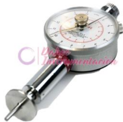
Penetrómetro fruta GY-3