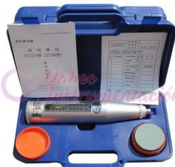
Esclerómetro Análogo HT225A