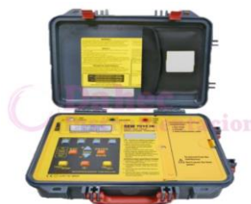
M. de Aislamiento SW-7015IN