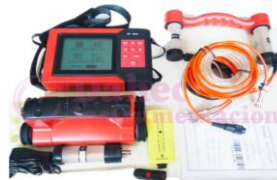
Pachometro Digital ZBL-R800