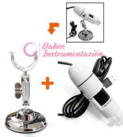
Microscopio Digital Usb CY-100 A 1000B