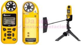
Anemómetro meteorológico K-5500