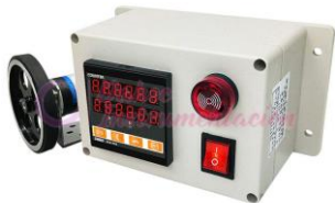
Cuenta metros con alarma 300PPR