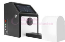
Medidor de haz YH1100