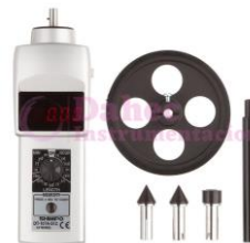
Tacómetro de Mano DT-150A-S12