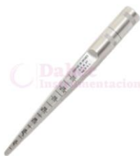
M. orificio de boquilla DF-PBFAST