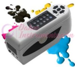
Medidor de Color NH300