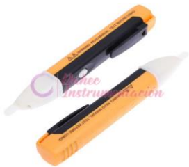
Detector de Voltaje T. pluma CATII-1000