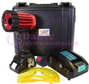
Lampara led UV LC-UV400B