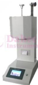
M. Índice de fluidez LY-XNR400E