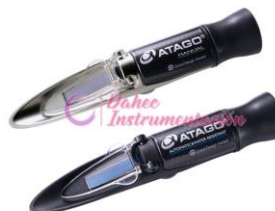
Refractómetro Análogo Atago Serie MASTER