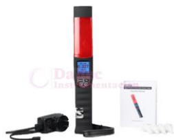
Alcoholímetro sin boquillas HW-AT7200