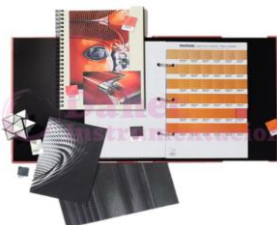
Premium Metallics Chips GB1505