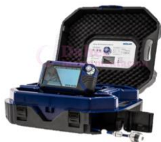
Baroscopio para Tubería VIS500