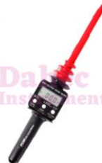
"DC Crest Meter" PW-149