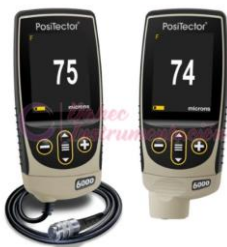
M. de espesor FE Y NFE Serie Positector