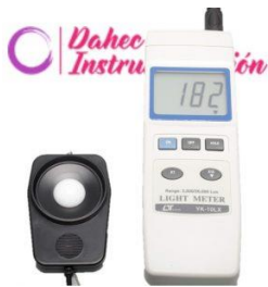
Luxómetro 20,000 lux LT-YK10LX