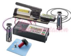
M. Adhesión Positest AT DF-ATA, DF-ATM