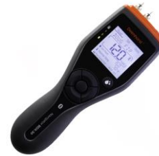
M. Humedad en papel DH-BDX20