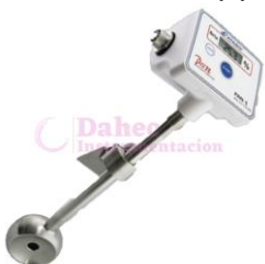
Refractómetro Inmersión AT-PAN1DC(L)