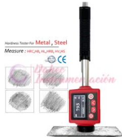
Durómetro de metal