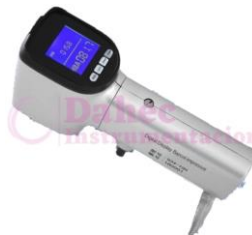
Durómetro Digital Babbitt