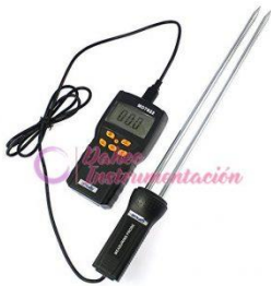
M. Humedad en Granos MD7822