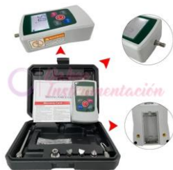
Dinamómetro digital AMF