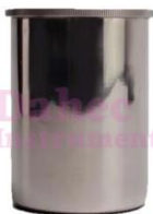
Copa de densidad 100ml QBB