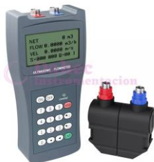
M. de flujo portátil MC-SUP2100H