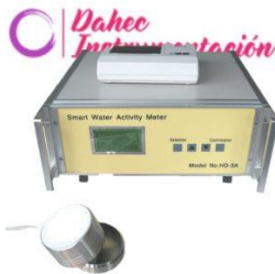
A. en agua 1 sensor ND-HD3A