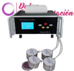
A. en agua 4 sensores ND-HD6