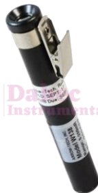
Dosímetro de Radiación AR-138