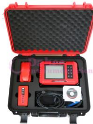
Localizador de Varilla JY-8S