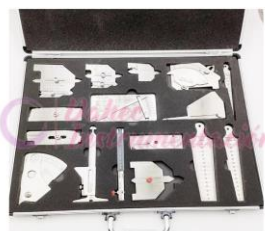
Kit de soldadura KIT16