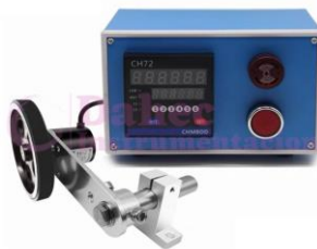
Cuenta Metros Digital CH72