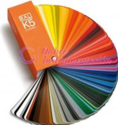
Cartas de Color Ral K5 Y K7