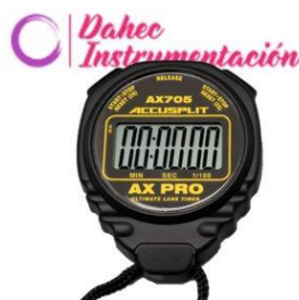
Cronometro Visualización AC-AX705