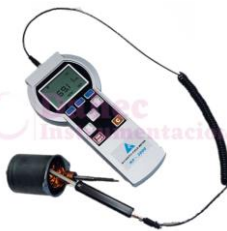
M. campo magnético MP-2000