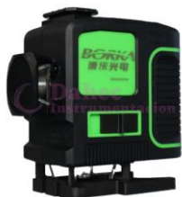
Nivel laser Boka TD12