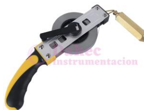
Cinta Petrolera Cekegon CK-650851