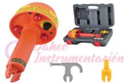
Detector de Voltaje 8 niveles SW-278HP