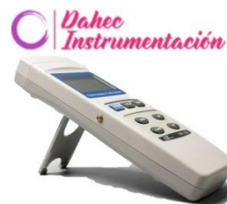
Gaussimetro 20,000 KV LT-ESF106