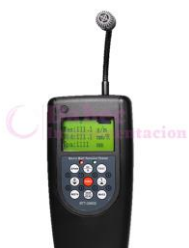
Medidor de tensión de Bandas BBT2880S