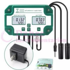
M. digital de temp de agua PH-3988