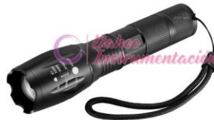
Lampara Led tactica DT-80862T6