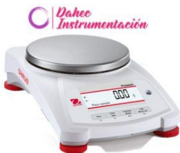
Balanza de Precisión Serie PX