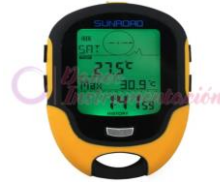
Altímetro 5 en 1 FR500-1