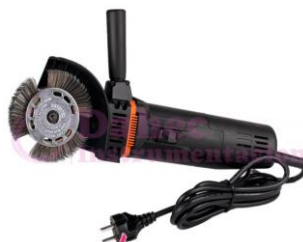
Bristle Blaster Electrico MO-SE667BMC