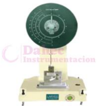
Impactómetro Analogo LY-ZIT2175 / 2122