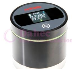
A. en agua AwEasy AwEasy