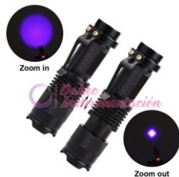
Linterna de luz UV SK68