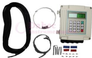
Caudalímetro Ultrasónico MC-SUP1158S 4050566