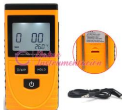
M. Resistencia Superficie GM3110