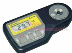
Refractómetro Paleta AT-PR32A