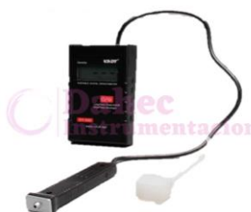
Densitómetro Portátil LC-DT200