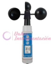
Anemómetro de copa LT-ABH4224