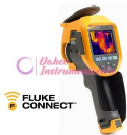
Cámara Termográfica Fluke TIS20