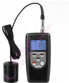
Colorímetro para textiles CM-200S