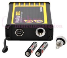
Registrador de Temp DF-OTLKIT