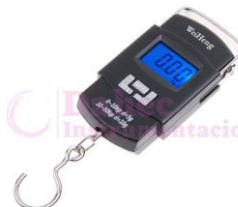
Balanza de mano 50kg WH-A08L