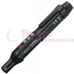
Detector fuga de gas FY8830