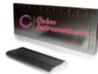
Medidor de Finura BGD242