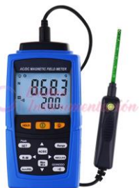
Gaussimetro con sonda Separada TM197