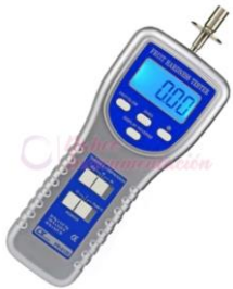
M. Dureza de Fruta FR5120