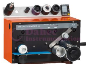
Comprobador de impresion Tintas UV/OFFSET