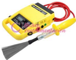
Detector de Porosidad PW-925 Y PW-935