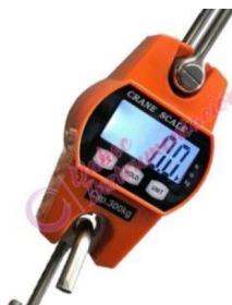
Dinamómetro a 300KG OSC-L300