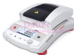
Analizador de humedad MB32