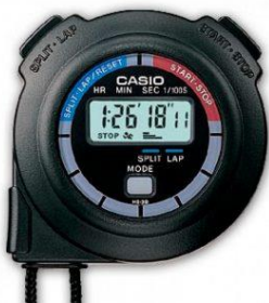
Cronometro Casio 1/100 HS3