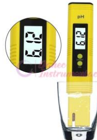
M. de Ph Auto calib OEM-PH14