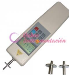
Penetrómetro Digital GY-4