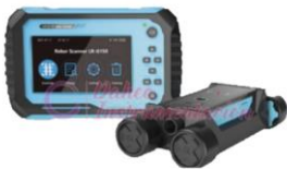
Localizador de Varilla JL-LRG150