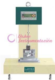
Impactómetro Digital LY-ZIT2275 / 2222