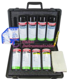
Kit Líquidos Penetrantes MF-SK816