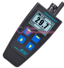
Punto de rocío Novotest KTR-1