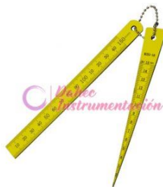
Calibrador cónico soldadura 1-15MM