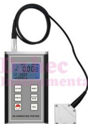
M. de Vibración VM-6380 Y 70