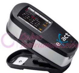
Densitómetro exact S Serie X-RITE