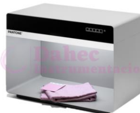
Cabina de Luz Pantone P5D50840