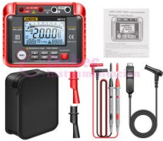
M. resistencia de tierra MH-13