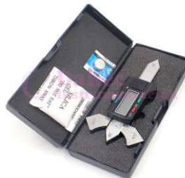
Calibrador de soldadura Digital WG-100