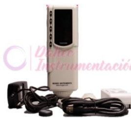
Colorímetro Portátil BGD551