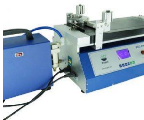
Aplicador con Bomba BGD218