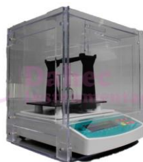
Densitómetro de Líquidos DI-AU300L