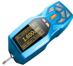
Rugosímetro Galaxy GL-GR290