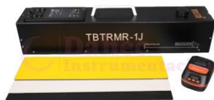
Retroreflectometro GPS NT-TBTRMR1