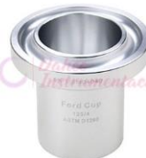
Copa Ford 4 y 5 BGD125