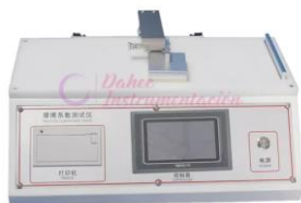
Coefficiente de fricción