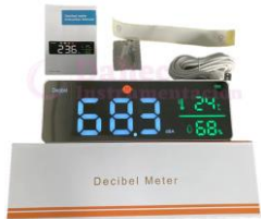
Medidor de decibeles LG-DM1306D