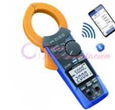
Amperímetro 200 AC/DC HK-CM4374