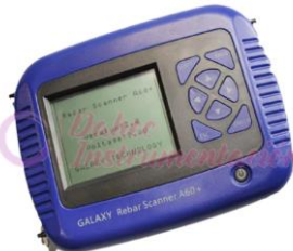
Localizador de Varilla GL-A60+