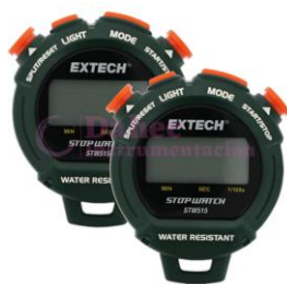
Cronometro Retroiluminada STW515