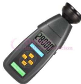
Estroboscopio Digital sin contacto DT2240B