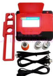
Detector de grietas SK-510