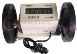
Cuenta Metros Digital DJ96-S