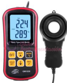
Medidor de luz digital GM1030