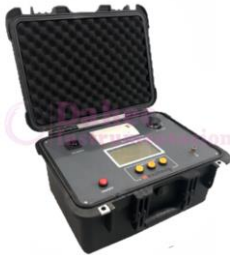
Probador de alta tensión HE-HZDP40KV