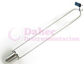
Copa Zahn 1 al 5 BL-Z