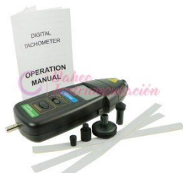
Tacómetro Dual DT2236B