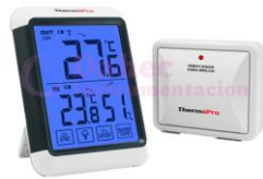
Estación Meteorológica Thermopro TP65