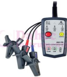
D. Secuencia de fase SW-895PR