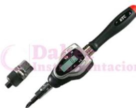
Torquímetro Desarmador IM-GLK...