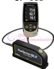
M.Brillo 20,60,85° DF-GLS