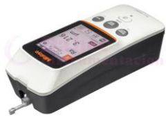
Rugosímetro Portátil SJ-220