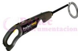
Detector Holiday DH-HHDKIT