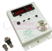
P. de Torque digital DI-4B-25