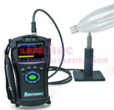
M. Espesor magnetico para botellas MT699B