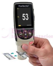
M. perfil de anclaje DF-RTR