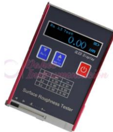
M. Rugosidad Digital GL-GR110