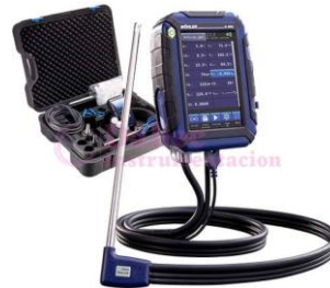
Analizador de Combustión WO-A450H