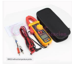
Amperímetro a 600V BM813