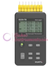
Registrador de datos Termopar S220-T8