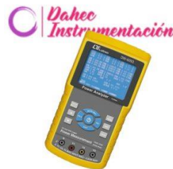
Analizador de Potencia a 600 ACV LT-DW6093