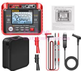
M. de resistencia tierra MH13