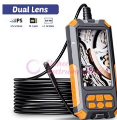
Baroscopio doble lente P50-10