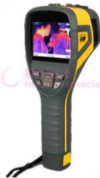
Cámara Termográfica GS-B160V