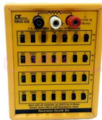
Década de Resistencia RBOX408