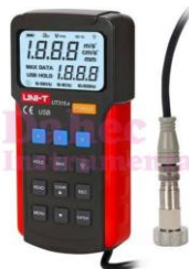
M. de vibración digital UT315