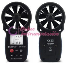
Anemómetro Digital 6 en 1 HP-866B