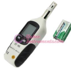
M. punto de rocío HT86