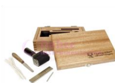
Pruebas de color QUICK PEEK