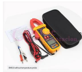
Amperímetro True-RMS BM813