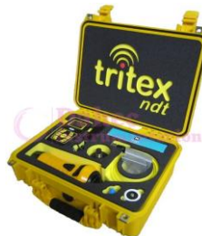
M. de Espesor submarino TR-303000