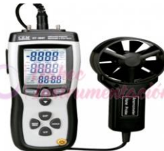
Termoanemómetro con Manómetro CM-DT8897