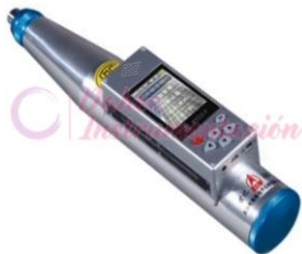
Esclerómetro Digital HT225V