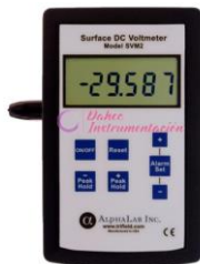
M. Electricidad Estática SVM2