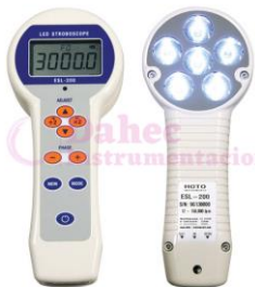
Estroboscopio Led UV ESL-200UV