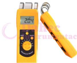
M. Humedad Textiles DM200T