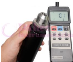
Torquímetro Dig 15 kg LT-TQ8800