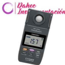
Luxómetro 200,000 lux HK-FT3424