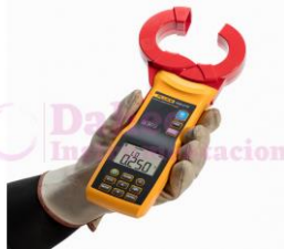
Medidor tierra gancho Fluke 1630-2FC