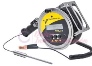
Termómetro petróleo TP7-D