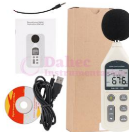
Sonómetro Digital GM1356