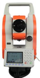
Estacion total sin reflector DTM-822R