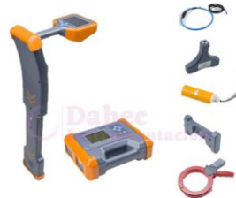
Localizador de Tubería PD-4950